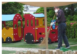
ギャラリー青空広場 公園の清掃