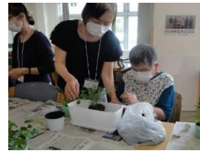
かしのき フラワーアレンジ