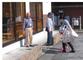
はこべ保育園 登園見守り