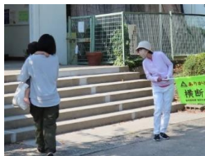
第六保育所 あいさつ・声かけ