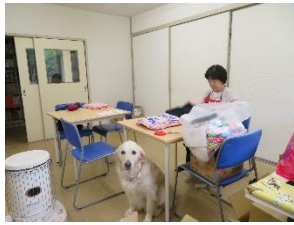
関西盲導犬協会 軽作業・事務