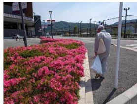
環境政策課 各駅クリーン作戦