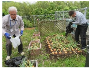
かめおかっこ広場 お庭の手入れ